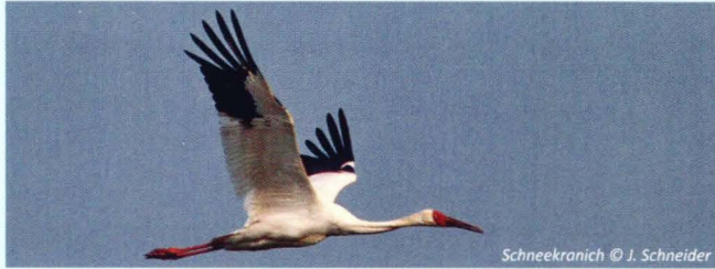
Schneekranich