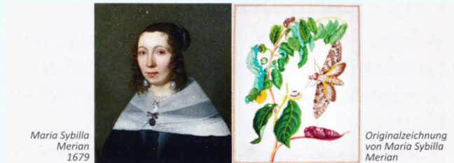
Maria Sibylla Merian 1679