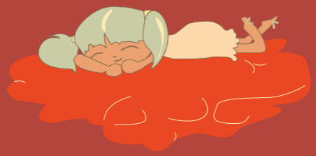
Illustration und Gestaltung:

Museum Lüneburg Deutsches Salzmuseum Ostpreußisches Landesmuseum Kloster Lüne